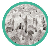
Открытые дентинные канальцы